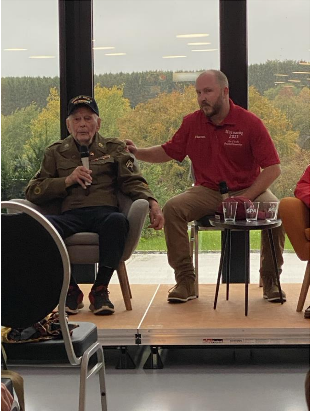
« Magic Bill »