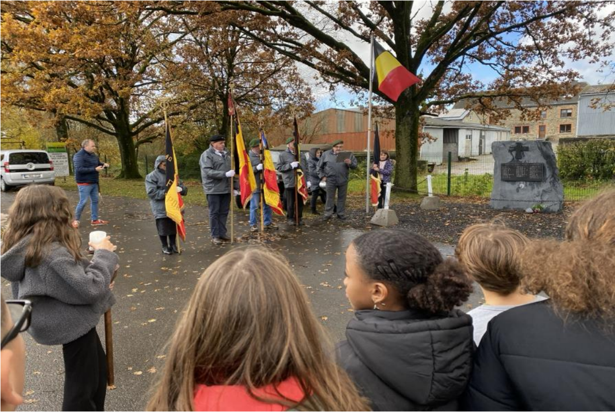
Monument à Chenogne.