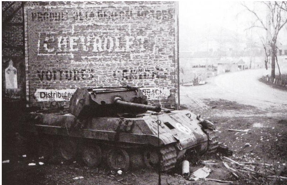
Ce char allemand plus ou moins camouflé en char américain a été détruit par Francis S. Currey à Malmedy, le 21 décembre 1944

Le sergent Currey a été crédité du sauvetage de cinq compatriotes américains, dont deux blessés.